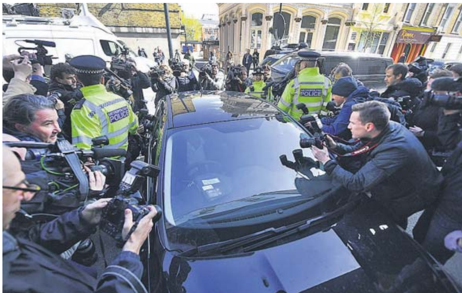
Periodistas se agolpan alrededor del coche en que Assange llegó al Tribunal de Westminster.

SIN ASILO El creador de WikiLeaks llevaba siete años viviendo en la embajada de Ecuador en Londres ARRESTO Scotland Yard sacó al periodista de la sede diplomática en volandas ACUSACIÓN EE UU pide su extradición por conspirar para acceder a documentos secretos