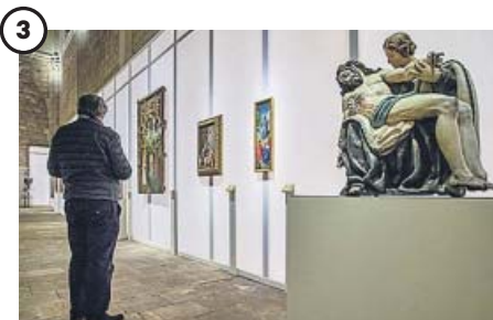
Nueva atracción turística Lerma cobra un nuevo interés como centro turístico gracias a esta exposición. La fundación ha conseguido atraer en las últimas tres décadas a más de once millones de visitantes.