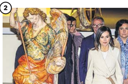
Un acontecimiento cultural La reina quiso estar en Lerma para apoyar la exposición, un acontecimiento cultural que pone en valor el patrimonio no solo de Lerma, sino de toda la comarca del Arlanza.