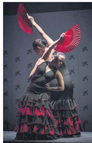
Los bailarines de Hacia dentro , en escena. EMILIO TENORIO

Espectáculos multidisciplinares para todos los públicos, como Picasso: la mirada en las manos (Culturactiva) y dramáticos, como Tullidos (Tarambana Espectáculos), tendrán lugar en el Teatro del Barrio.