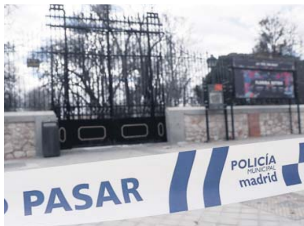
El Retiro cerró en marzo del año pasado por el mal tiempo.

El nivel rojo, que supone suspender todas las actividades y desalojar el parque, se podrá activar con rachas de viento iguales o superiores a 55 km/h y cuando la temperatura máxima supere los 35 grados y la humedad del suelo esté por encima del 75%. También cuando la temperatura y la humedad estén por debajo de los nive-