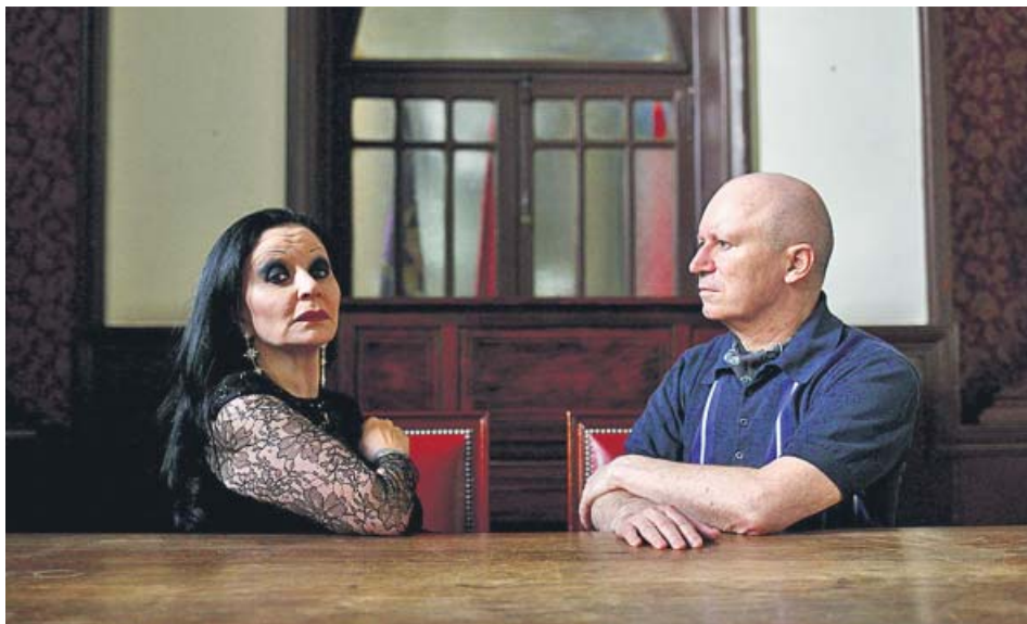
Alaska y Nacho Canut, durante la promoción de su último disco.