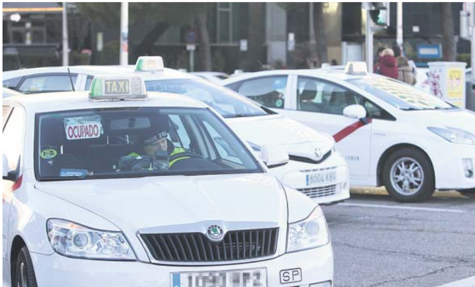
Un taxista ataviado con un gorro en el interior de su vehículo. JORGE PARÍS

EL CONSISTORIO de Madrid modificará la ordenanza del sector para establecer pautas en la uniformidad de los conductores